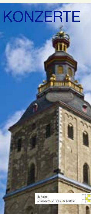
St. Agnes St. Kumbert - St. Ursula - St. Gertrud

Das Konzert am Sonntag, den 6. April um 16 Uhr in St. Ursula in Köln möchte die Zuhörer in die Themenkreise Frieden und Passion hineinführen. Das Passionsthema wird aufgefächert durch ausgewählte Choräle aus der Johannes-Passion (BWV 245) von Johann Sebastian Bach. Diese werden wiederum thematisch ausgedeutet durch Motetten aus 4 Jahrhunderten. Die Themenbereiche werden durch eine Gegenüberstellung von Zitaten aus den vertonten Texten konkretisiert und laden zur persönlichen Andacht ein.