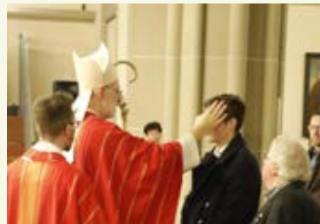
Weihbischof Ansgar Puff segnet Firmand

Alle Jugendlichen, die bis zum Firmtag das 16. Lebensalter erreicht haben, sind eingeladen.