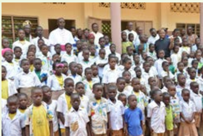
Schulkinder vor ihrer neuen Schule