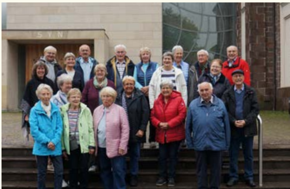
Gruppenfoto an Doppelkirche von Sinich

Die Vielfalt der Teilnehmer förderte einen respektvollen Austausch. Trotz unterschiedlicher Ansichten war man