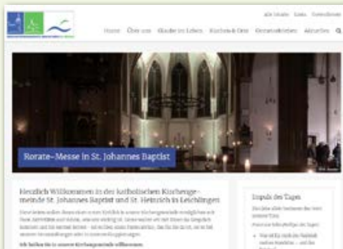
Ausschnitt der Startseite der neuen Pfarrhomepage

Die Umstellung erfolgte manuell. Um den Aufwand in Grenzen zu halten, wurden nur einige Berichte übertragen. Falls Sie Informationen vermissen oder Zugriff auf bestimmte, frühere Inhalte wünschen, teilen Sie uns dies bitte mit. In einer Übergangszeit stehen uns die alten Inhalte noch zur