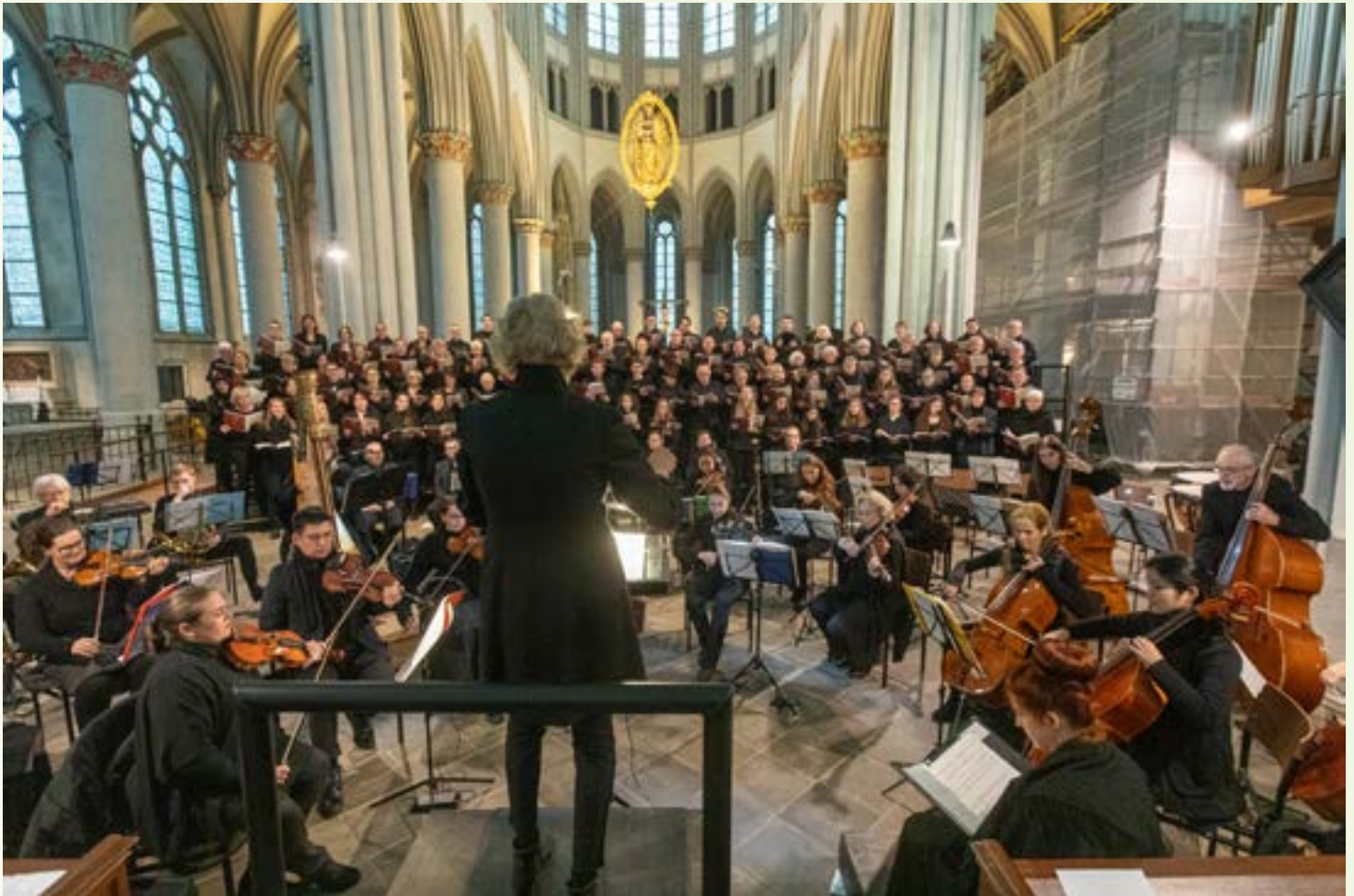
Chöre, Solosängerin, Harfenistin und Orchester hinterließen musikalisch ein großes Ausrufezeichen