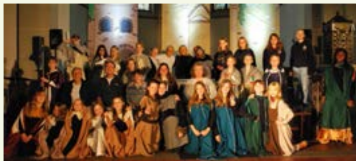
Musical Franziskus - 2024