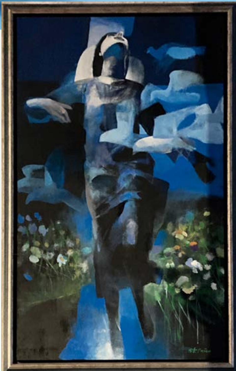
Gemälde in der Kathedrale Nuestra Señora de la Asunción in Santander

Vor dem Hintergrund der unbedingten und grenzenlosen Liebe Gottes zu uns können wir den Mut fassen und uns erlauben, sogar unser Scheitern zu akzeptieren und es als Teil unseres Lebens zu sehen und anzunehmen. Hüten wir uns allerdings davor, die Barmherzigkeit Gottes als selbstverständlich anzusehen und sie zu missbrauchen, indem wir unsere Schuld, unser Versagen, unser Scheitern auf die leichte Schulter nehmen, weil wir meinen, so schlimm ist es ja nicht! Das wäre fatal! Sünde bleibt Sünde, die lässliche wie die Todsünde, und Gott verachtet sie alle, aber Er verachtet den Sünder nicht – diesen fundamentalen Unterscheid sollten wir uns immer deutlich vor Augen führen!