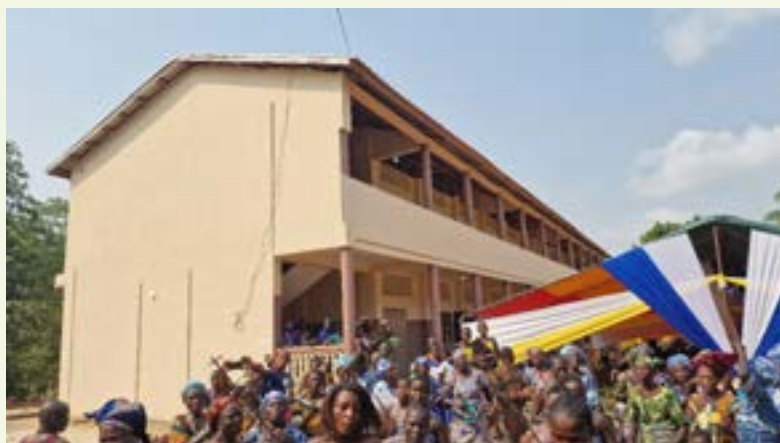
Einweihung des Schulgebäudes