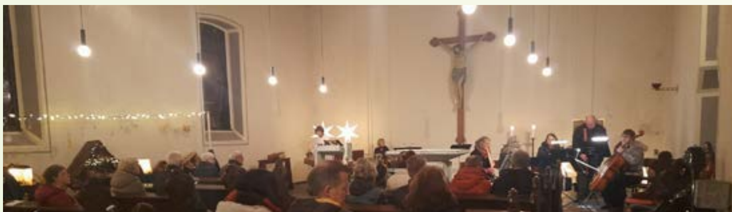
Weihnachtskonzert in der Alten Kirche