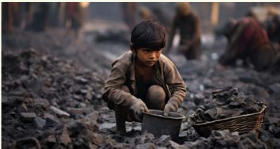
12. Juni: Welttag gegen Kinderarbeit

Kinderarbeit wird das Thema der kommenden Sternsinger-Aktion sein. Sei dabei und unterstütze dieses wichtige Ziel: die Abschaffung von Kinderarbeit.