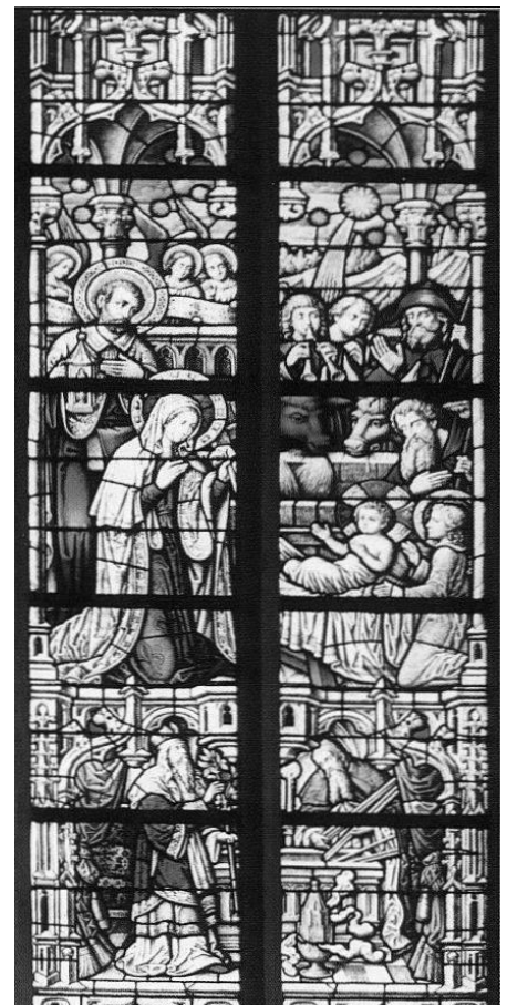
Fenster mit der Geburt Christ

Der untere Teil zeigt uns Moses, der den Kindern Israels die eherne Schlange zeigt, die er an einem Pfahl aufrichtet, damit alle, die von gif-