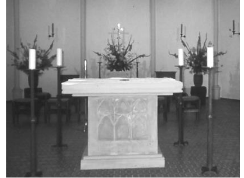
Hochaltar ab 1970

Die Heizung wurde erneuert und die Turmuhr auf elektrische Steuerung umgebaut. Gesamtkosten: 521.828 DM.