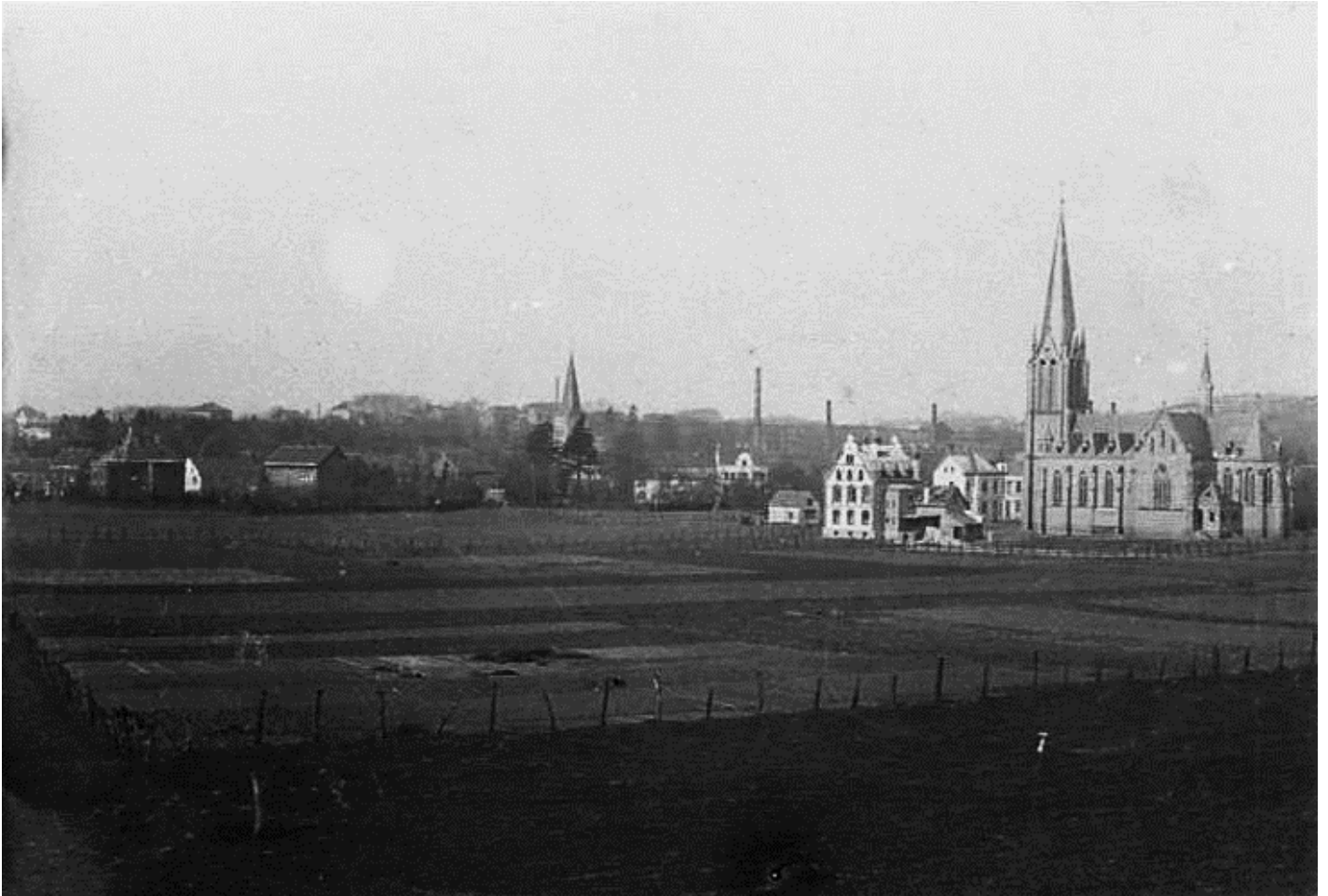
Pfarrkirche mit Umfeld bis Ende der 1950er Jahre

Redaktion: Barbara Reul-Nocke, Hans Josef Gläser: (aus Archiv und den Festschriften)