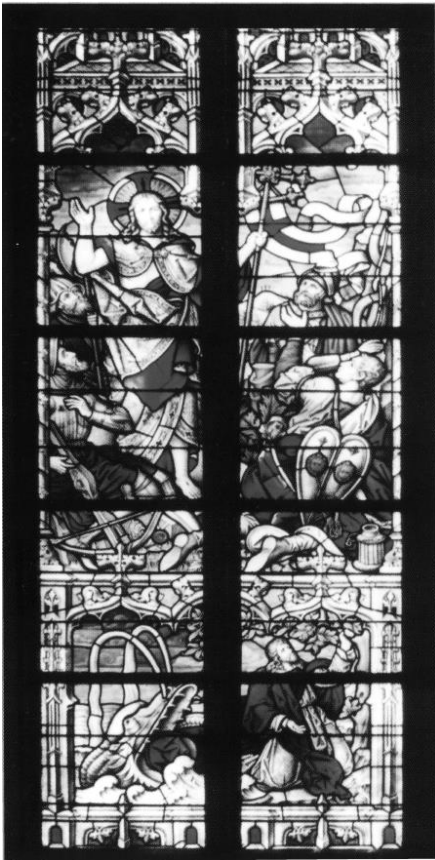
Fenster mit der Auferstehung

In der Fensterspitze ist Gottvater dargestellt.