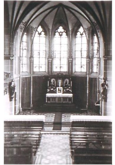
Chor und Hochaltar bis 1953

Der Neubau hat vor 100 Jahren 186.674,94 Mark gekostet. (Die Kosten des Kirchbaues wurden ca. \frac{1}{3} teurer als geplant. Der Bauplatz liegt im ehemaligen Wupperbett, der Grundwasserspiegel ist daher relativ hoch, somit mussten die Grundmauern sehr verstärkt werden.)