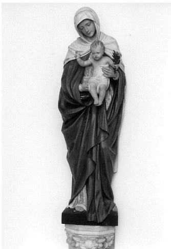
Maria vom Frieden

1914 wurde die Turmuhr eingebaut, ein mechanisches Uhrwerk mit Betongewichten. Das Uhrwerk ist heute noch unter der Glockenstube vorhanden.