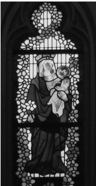
Jesuskind mit dem Apfel

Erwähnenswert ist noch das Fenster im Turmeingangsbereich, welches Maria mit dem Kind mit einem Apfel in der Hand , statt der Weltkugel, umgeben von einem Kranz von Blütenornamenten darstellt. Als besondere Referenz an die Obst- und Blütenstadt. In den 1980er Jahren wurde das Fenster von einer Leichlingerin gestiftet.