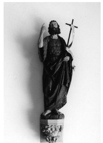
Johannes der Täufer

In den Jahren 1953-54 wurde die Kirche unter